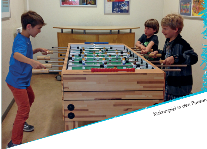
Kickerspiel in den Pausen