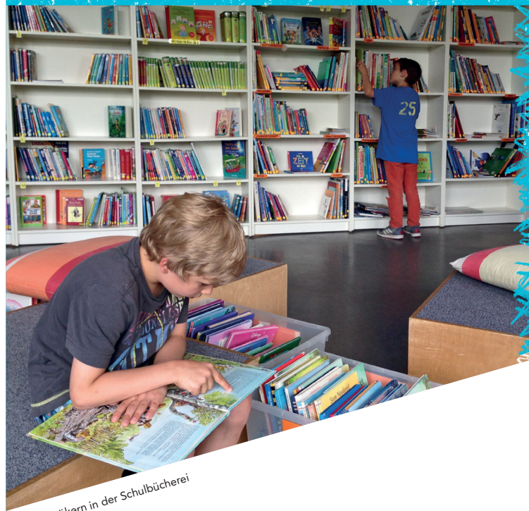
Schmökern in der Schulbücherei

Informationen zu SEPA-Mandaten / informations about sepa-mandate: www.sepa-mandat.de Verantwortlich für die Verwendung dieses Formulars ist ausschließlich der Zahlungsempfänger Förderverein der Grundschule am Königsgraben e.V. · 12249 Berlin